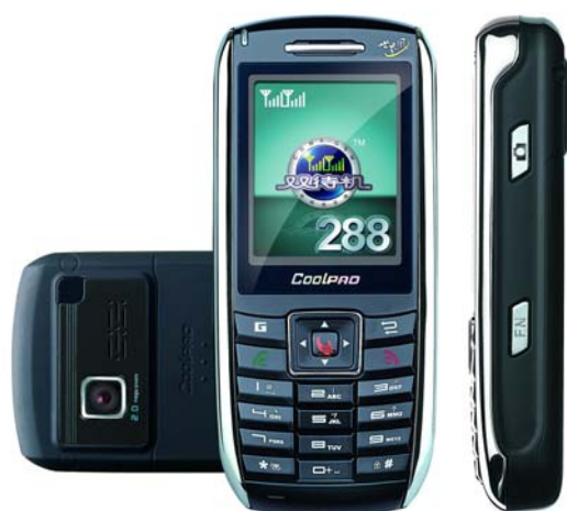
「酷派 288」(“Coolpad 288”) 雙模雙待機智能