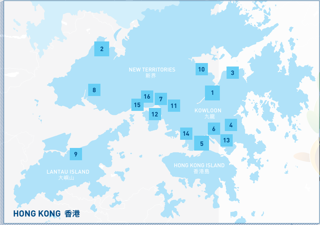
HONG KONG 香港