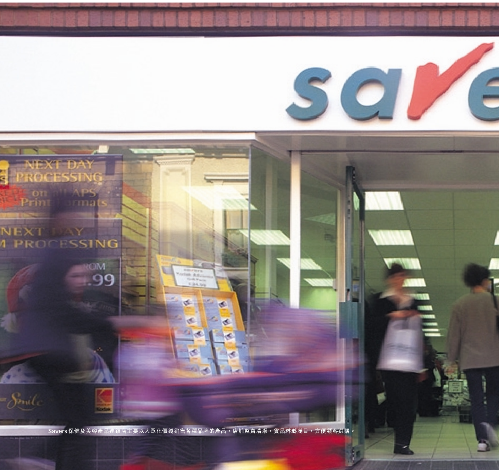
Savers 保健及美容產品連鎖店主要以大眾化價錢銷售各種品牌的產品，店舖整齊清潔，貨品琳琅滿目，方便顧客選購。