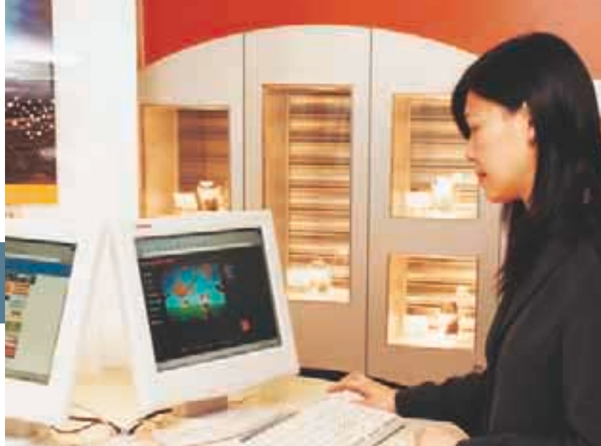
和記電訊澳門專門店特設資訊專站，客戶可瀏覽互聯網及查閱最新產品及服務。