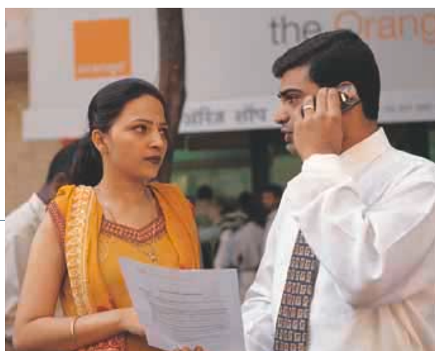
流動電話在印度日趨流行。目前全國有六百多萬名流動電話用戶，每月增長率超過百分之五。

在印度，集團擁有四項2G電訊業務的百分之四十九權益，包括：孟買的Hutchison Max Telecom、德里的Sterling Cellular、加爾各答的Usha Martin Telekom及古吉拉特邦的Fascel。於二〇〇一年下半年，集團與Essar Group組成之合資公司投得額外三個流動通訊牌照，總成本為九千九百萬美元，可在卡納塔克邦（包括班加羅爾市）、安得拉邦（包括海德拉巴市）及清奈市，預計可於二〇〇二年中開始投入服務。在這個迅速增長的流動電訊市場，四項現有業務於本年度錄得百分之八十一的大幅增長，合計用戶人數目前共有超過一百二十萬名，利息及稅前盈利較上年度上升近一倍。