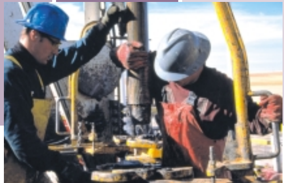
兩名油井修建工人正在一個勘探石油鑽井上準備一支新的鑽桿。

(一九九九年之平均數額為十一萬零四百BOE)。於二〇〇〇年底時，已探明之石油及天然氣蘊藏量估計達八億七千二百萬BOE，而石油生產排替率則達百分之一百四十三。赫斯基能源持有大幅土地，其中包括加拿大西部尚待開發之八百六十萬英畝土地，可供未來勘探及開發傳統原油及天然氣，以及重油的儲藏量。上游業務方面，赫斯基能源繼續在加拿大東岸發展及開採石油項目，其中Terra Nova油井預計於年底前投產。赫斯基能源並已於今年初向有關當局提交開採White Rose油井之申請，預計該油井可於二〇〇四年投產。此外，赫斯基能源是加拿大東岸海洋Jeanne d'Arc盆地最大投資者