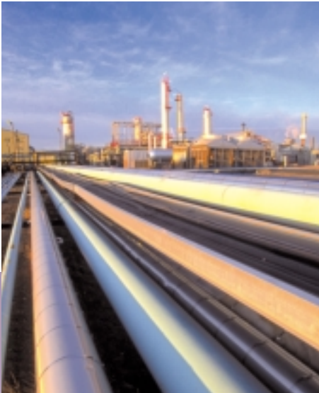
赫斯基能源一千九百公里的管道系統將艾伯塔省和薩斯喀徹溫省出產的石油輸送到該公司在Lloydminster的煉油設備。