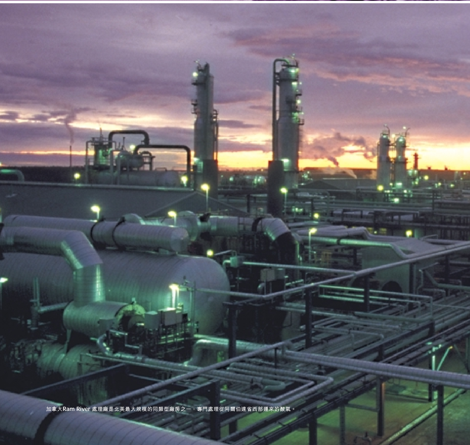
加拿大Ram River 處理廠是北美最大規模的同類型廠房之一，專門處理從阿爾伯達省西部運來的酸氣。