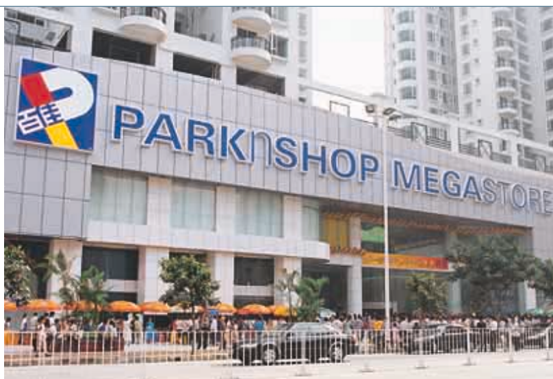
百佳成功在華南地區引進大型購物廣場的新概念。

集團之非食品零售業務包括屈臣氏大藥房及Savers。屈臣氏大藥房是首屈一指之個人護理產品連鎖店，在香港、台灣、中國內地及東南亞各國享負盛名；Savers則是英國一家保健及美容產品連鎖店。此等業務之合計銷售額較上年度增加百分之十四，利息及稅前盈利則與上年度相若。屈臣氏大藥房在亞洲繼續擴充，商店數目在本年度增加二十八間，使區內總數達到超過五百六十間。在香港，屈臣氏大藥房之總銷售量輕微上升，但由於經濟不景，利息及稅前盈利低於上一年度。內地之銷售量增加百分之十五，並錄得良好業績。台灣方面因當地經濟放緩，新台幣匯率下調及經營遇到阻滯而錄得較上年度減少百分之十五之銷售量，利息及稅前盈利亦大幅下降。該公司新上任之管理層正著手處理上述困難，重整旗鼓，務求改善業績。在東南亞，屈臣氏大藥房於新加坡、馬來西亞及泰國之銷售量較上年度增加百分之三，利息及稅前盈利亦有上升。集團於二〇〇〇年九月收購之英國Savers連鎖店在本年度積極增設商店，至年底為止，商店數目已增至超過二百三十間。由於成功增加商店，加上各店之銷售量大幅上升，Savers本年度錄得大幅增長，業績較預期為佳。該公司已積極部署下一步之擴展計劃。