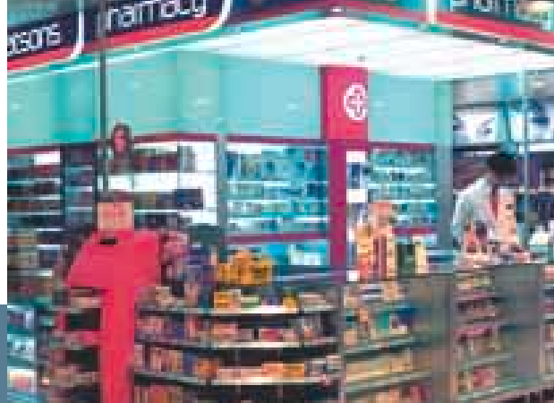
屈臣氏個人護理商店始終是亞洲最著名的保健及美容產品零售店。