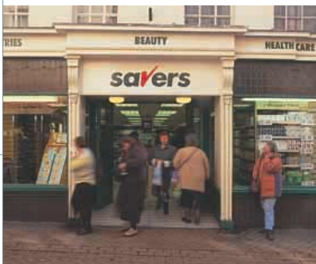
Savers 保健及美容產品連鎖店在英國繼續錄得迅速增長，提供物超所值的產品，方便顧客選購。

集團在內地之主要投資包括持有寶潔-和記有限公司百分之二十權益。該合資公司生產及分銷一系列美髮品、護膚品、香皂、清潔劑、牙齒護理及紙類產品，銷售點遍及全國。由於該公司本年度有一次過之企業重組支出，又於年內面對本地及國際投資者之激烈競爭，因此對集團之利息及稅前盈利貢獻較上年度減少。