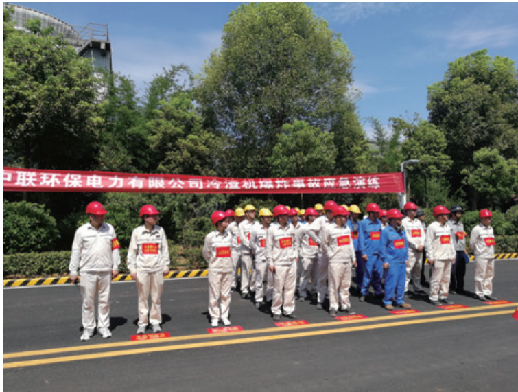
爆炸事故應急演練

本集團堅持「安全發展」科學理念和「安全第一、預防為主、綜合治理」的安全工作方針，完善安全三級管理網路，落實安全生產責任制，開展各項安全生產管理工作，全面提升現場安全管理水準。全面提高員工安全意識；消除「人的不安全行為、物的不安全狀態和環境的不安全因素」，通過開展定期、不定期、季節性設備隱患排查與整治工作，消除事故隱患。全年未發生重大火災、重大設備損壞、重大人身傷害、重大環境污染事故。其中湖南常德項目連續6年被常德市經濟開發區安全監管部門評為「安全生產先進單位」，並數次獲得市級「消防安全先進單位」稱號。山東泰安項目榮獲山東省《電力安全生產標準化二級企業》資質及「安全生產先進單位」榮譽稱號。