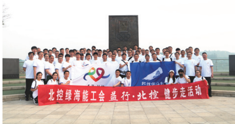
2018北控綠海能工會益行、北控健步走活動