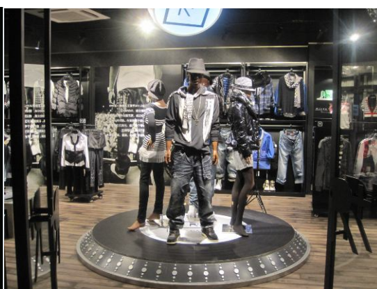
品牌專門店設計貫徹「Rocawear」街頭潮流主題