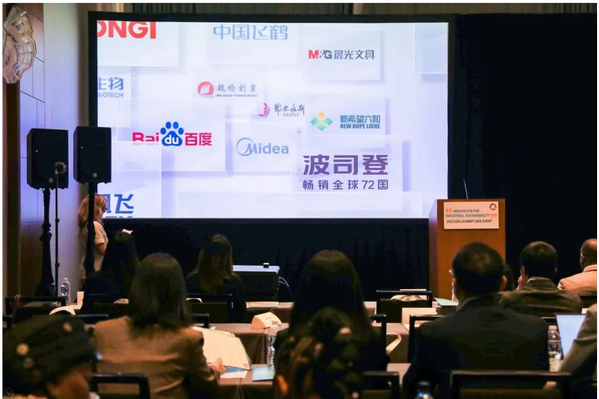
首批签署“可持续产业发展共识”倡议

波司登首批签署“工商界在行动-可持续产业发展共识”倡议并发布，倡议共十条内容，倡导工商界在资源利用、可再生能源使用、技术创新、包容性发展、可持续国际合作等方面凝聚产业发展共识，并承诺以务实行动推动高质量发展，支持联合国2030年可持续发展议程，展现了中国纺织服装领军品牌承担国际责任的坚定态度。