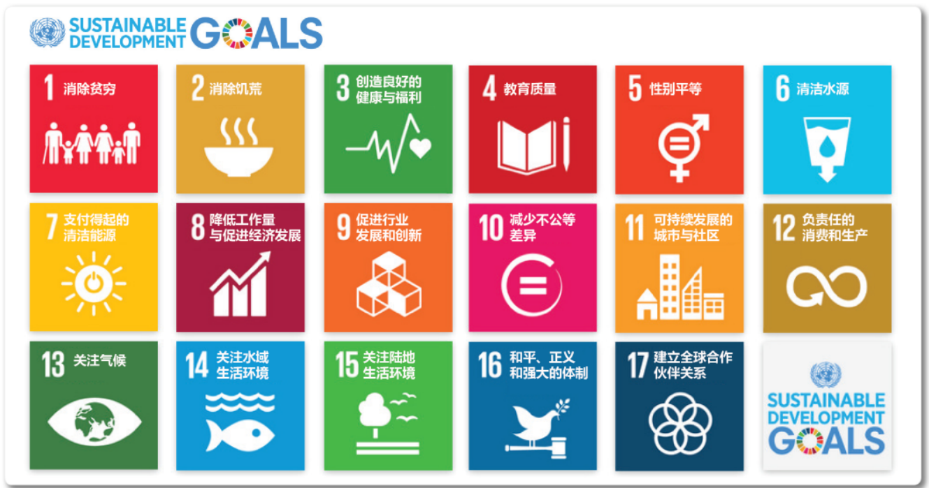
联合国可持续发展目标(SDGs)