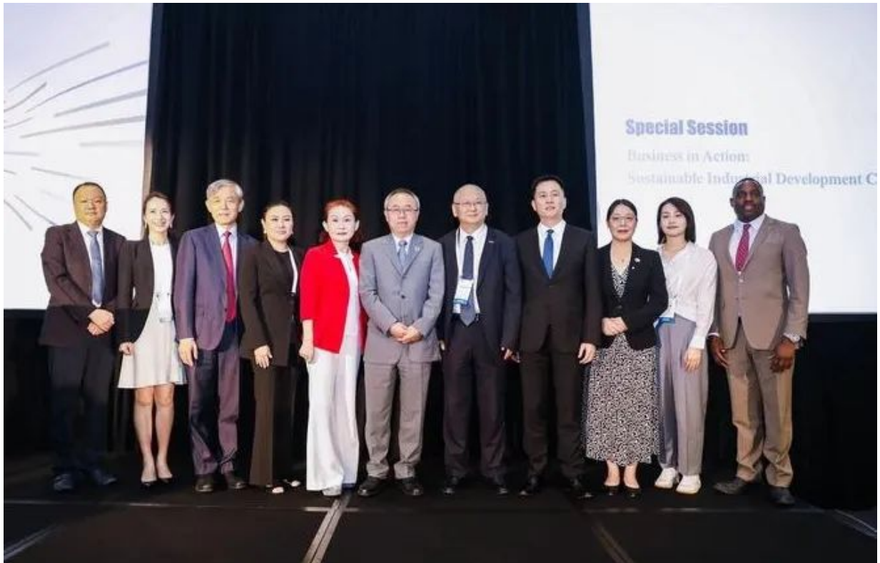
波司登代表出席2023年联合国可持续发展目标峰会官方边会

近日，2023年联合国可持续发展目标峰会官方边会“产业可持续创新”主题活动在纽约举行。波司登集团作为中国工商界优秀企业代表，受邀出席会议并就公私合作伙伴关系、可持续产业创新实践等议题进行对话交流。