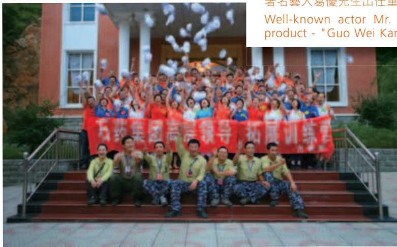
員工培訓活動。 Staff training programme.