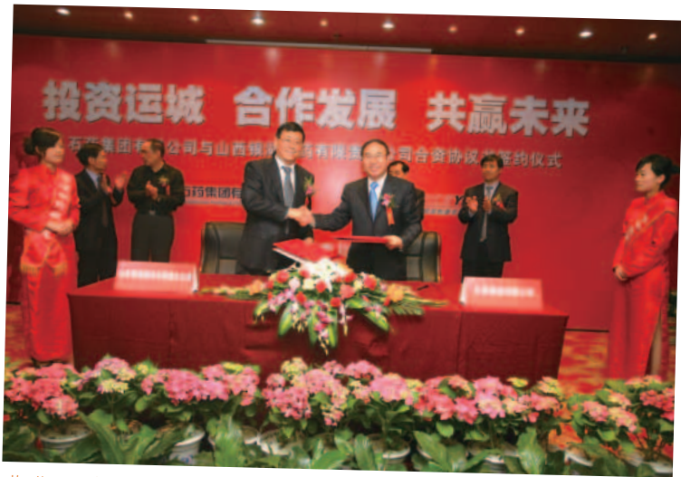
收購山西銀湖的簽約儀式。 The signing ceremony for the acquisition of Shanxi Yinhu.