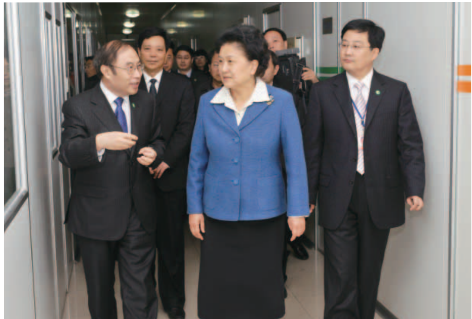
國務院委員劉延東女士到本集團考察。 Madam Liu Yandong (State Councilor) visited our Group.