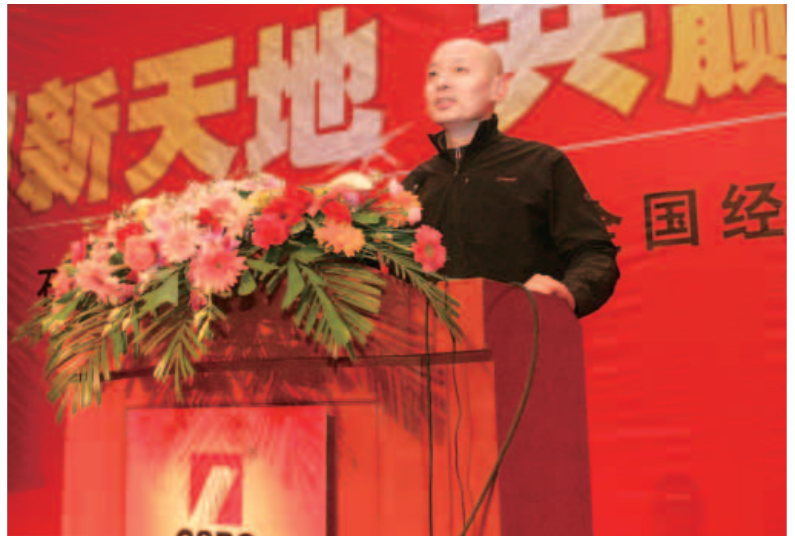
著名藝人葛優先生出任重點產品<果維康>維生素C含片的產品代言人。 Well-known actor Mr. Ge You acted as the spokesperson of our product - "Guo Wei Kang" vitamin C buccal tablets.