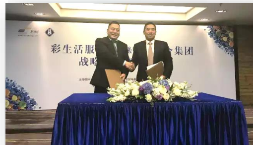
彩生活與中房聯合集團達成戰略合作