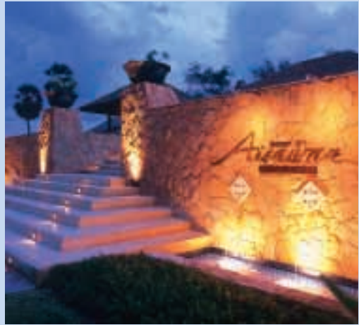
芭堤雅Aisawan Resort & Spa前景

本集團與Morgan Stanley Real Estate Funds及PamFleet Investments Limited成立一間合營公司，該合營公司擁有位於銅鑼灣怡和街68號面積217,625平方呎的物業及位於九龍城面積達640,000平方呎的KCP九龍城廣場。KCP九龍城廣場已於二零零六年十一月完成翻新，上述兩項物業的出租情況理想。