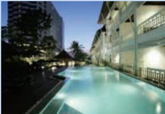
芭堤雅Aisawan Resort & Spa「Pool Lanai」外景

於截至二零零六年十二月三十一日止年度，位於泰國芭堤雅的Aisawan Resort & Spa錄得收益300,900,000泰銖，而二零零五年度為251,800,000泰銖。同期經營毛利為164,900,000泰銖（二零零五年：128,600,000泰銖）。儘管於二零零六年五月至九月期間，Aisawan Resort & Spa因進行大規模翻新所有園林客房（佔所有房間約25%）及興建三個新游泳池而關閉園林別墅部分，但Aisawan Resort & Spa仍錄得上述收益和經營毛利。裝修後的園林客房於二零零六年十月底命名為「Pool Lanai」重新開業。於二零零七年一月至三月之旺季期間，渡假村全面營運，收益增長26%及經營毛利按年增長36%至94,200,000泰銖。透過一間聯營公司，Aisawan Resort & Spa於本呈報期間向本集團貢獻港幣13,900,000元（二零零六年：港幣10,900,000元）。