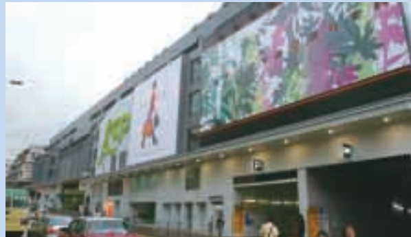
九龍城KCP九龍城廣場新外觀

誠如先前報告提及，本集團與Morgan Stanley Real Estate Funds及Wachovia Development Corporation成立了一間合營公司，在澳門收購一幢22層高、面積約為437,000平方呎的商業樓宇。該樓宇的翻新工程已於二零零六年第二季如期完成。美國保險公司美國友邦保險有限公司為該樓宇之主要租戶，而該樓宇已改名為澳門友邦廣場。作為一間聯營公司，此項目於期內為本集團貢獻港幣16,600,000元，該貢獻主要由於物業估值增加至港幣956,000,000元，較其收購成本有約59%升幅。