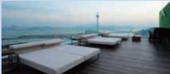
澳門友邦廣場天台餐廳

本集團為Gateway China Fund I（「該基金」）的策略性夥伴。該基金為一個總值198,900,000美元的地產基金，主要投資中國、香港及澳門的房地產項目。另外，本集團亦透過其擁有50%權益的聯營公司答允向該基金投資5,000,000美元，約佔該基金的資本2.5%。於本呈報期內，該基金已投資其資本約84%。