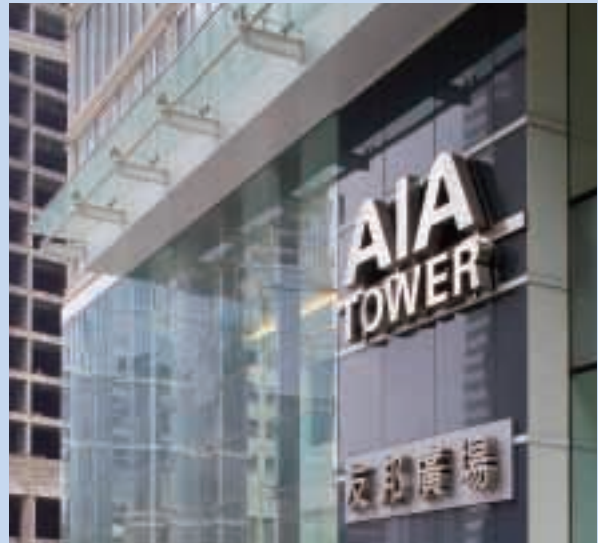
澳門友邦廣場前景