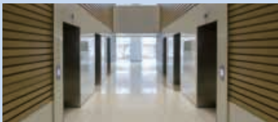
澳門友邦廣場辦公室電梯大堂