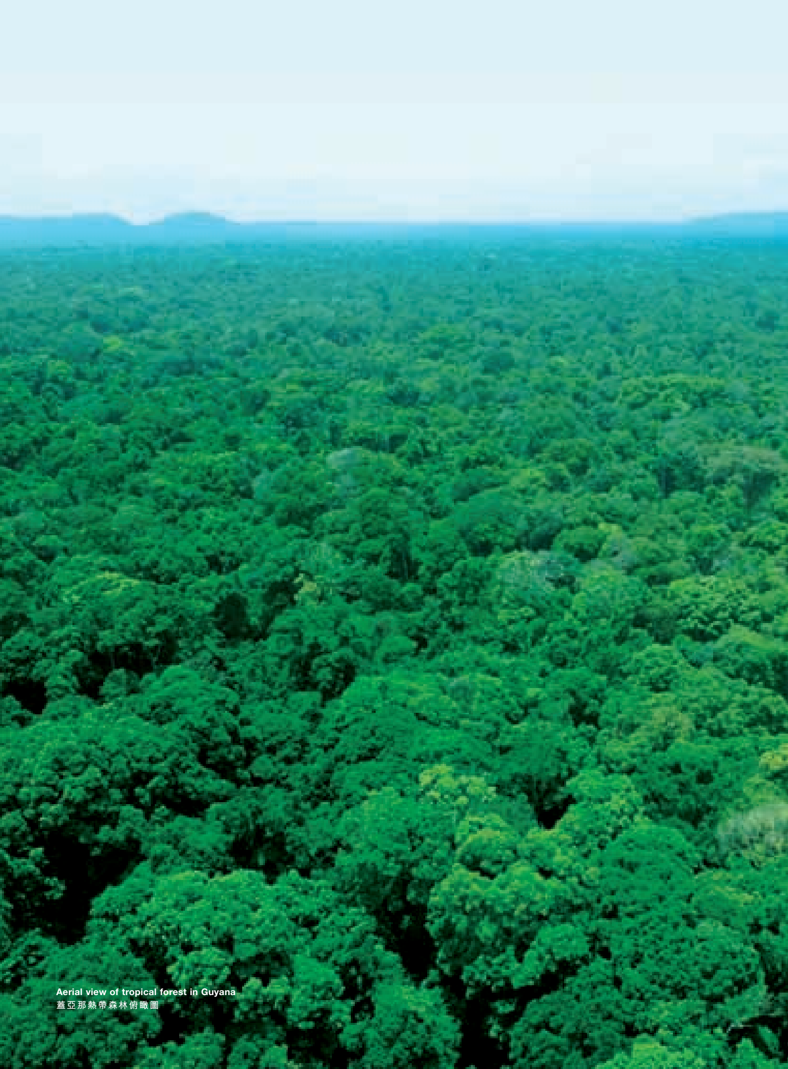
Aerial view of tropical forest in Guyana 蓋亞那熱帶森林俯瞰圖