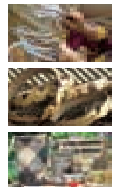
■ 二零零七年十一月，Janji團隊走訪本南村的Long Benalih及Kelabit村的Long Lellang。聽聞過Janji創舉的大量鄰近地區的村民亦趕來與該團隊會面。