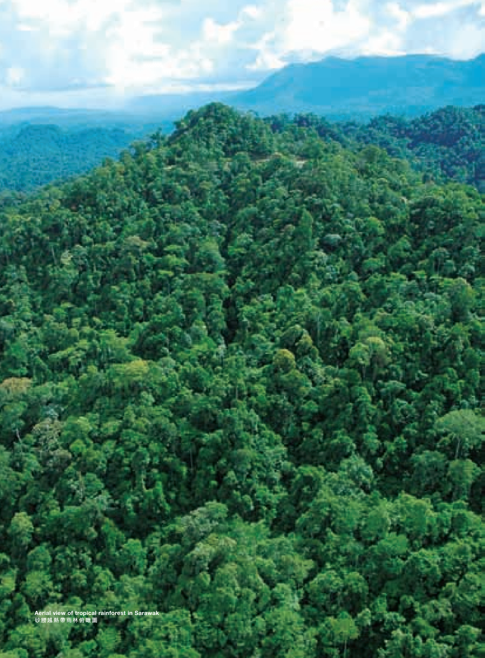
Aerial view of tropical rainforest in Sarawak 砂朥越熱帶雨林俯瞰圖