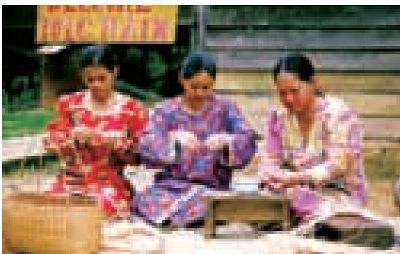
■ 二零零七年八月，Janji團隊走訪砂朥越Ulu Baram地區本南村的Long Main及Kenyah村的Long Semiyang。

長遠來看，我們的社區技能計劃旨在傳授令社區成員轉為更自立及獨立的生活技巧。 Janji 馬來語指承諾，乃本集團推動原住民藝術及手工藝的一個舉措。一間 Janji 銷售專門店已在馬來西亞首屈一指的購物中心Suria KLCC設立，其向廣闊的市場提供零售機會。