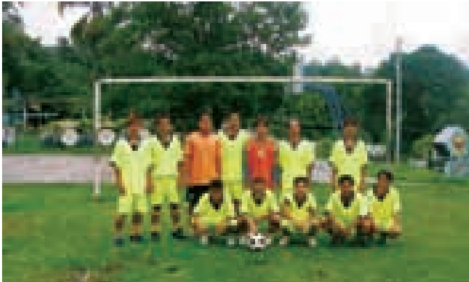
■ 二零零七年十一月，來自砂朥越Ulu Baram區本南、Kelabit及Kenyah部落的七個村莊的50多個青年走到一起，參加首次舉行的Long San杯足球比賽。本集團與村莊的青年及其他社會成員共同工作組織比賽，此次比賽成為促進全社會青年互動的有效方式。