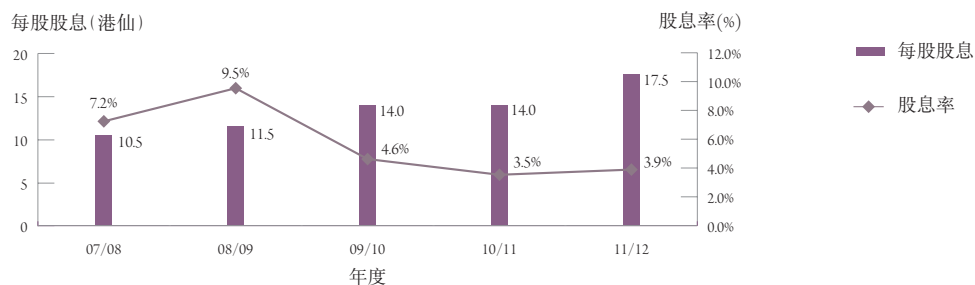
每股股息及股息率 (附註1)