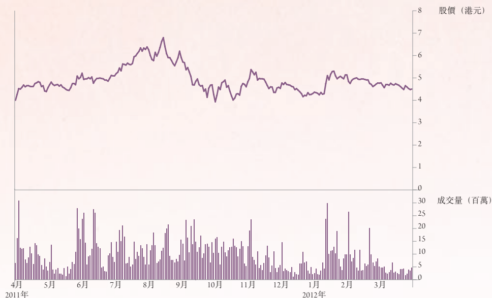
2011/12財政年度股價及成交量