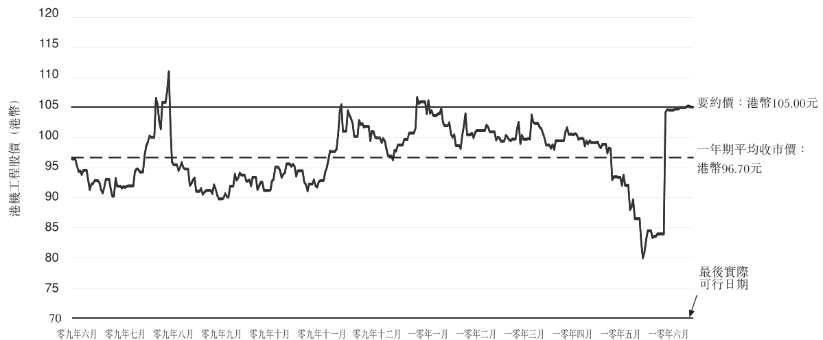
圖二：一年期及截至最後實際可行日期(包括該日)止的港機工程股份每日收市價

以下圖二列示自二零零九年六月五日起至最後交易日(包括該日)止期間(「一年期」), 及直至最後實際可行日期(包括該日)止的港機工程股份每日收市價。