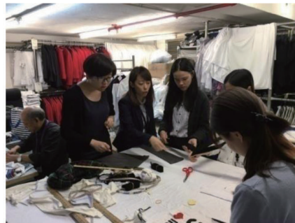
DIY環保袋工作坊(八月)