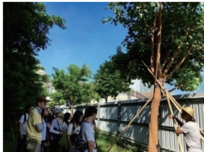
澳門生態區遊(九月)