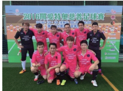
特殊奧運足球賽(十月)