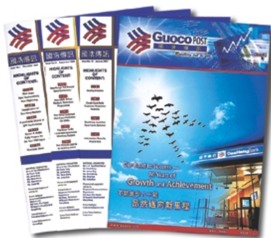
本集團之內部雜誌 - GuocoPost

於二零零一年六月三十日，本集團(包括其香港及海外附屬公司)僱用約500名僱員。本集團持續採取相同之方針，管理其員工數目及致力為員工提供持續培訓課程。