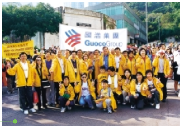
本集團參與公益金一年一度之慈善活動「百萬行」。