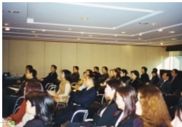
員工出席個人資料保障原則之講座。

本集團之僱員酬金政策由管理層定期審閱。本集團會考慮其經營業務所在國家及有關業務之薪酬水平及組合，及普遍市況後，設立酬金福利。花紅及其他獎金會與本集團之財務表現及個別僱員表現掛勾，以作為全面發揮表現之獎勵。此外，本集團已根據股份認購權計劃之條款，授予若干本集團之合資格董事及僱員股份認購權。