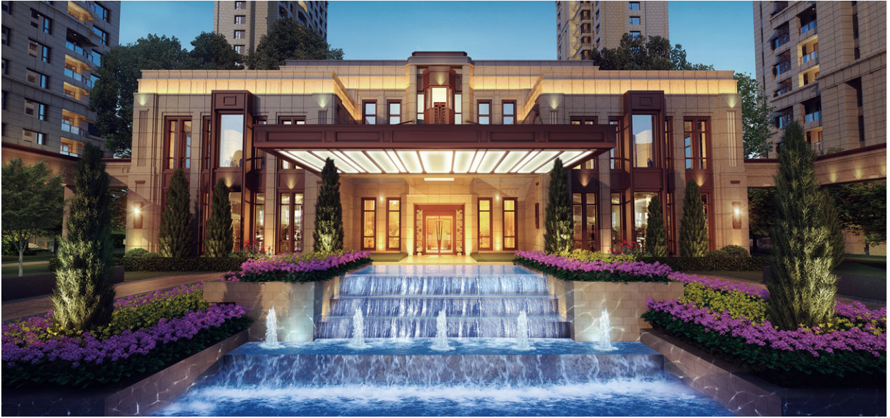
上海長風匯都會所(構思圖)