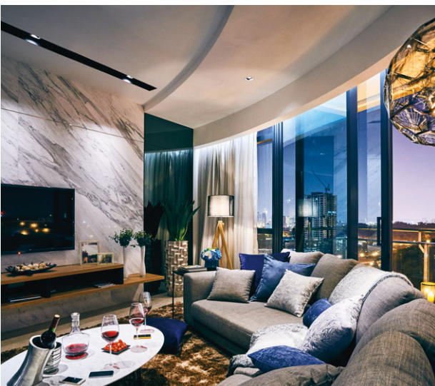
馬來西亞DC Residency示範單位客廳(構思圖)

在中國，根據中華人民共和國國家統計局於二零一六年六月的調查顯示，新房價格於70個城市中有55個持續按月上升。於二零一六年六月，上海房價按月及按年分別上升2.4%及33.7%。近期在較大城市推出的樓市降溫措施已開始令有關城市之房價升勢放緩。