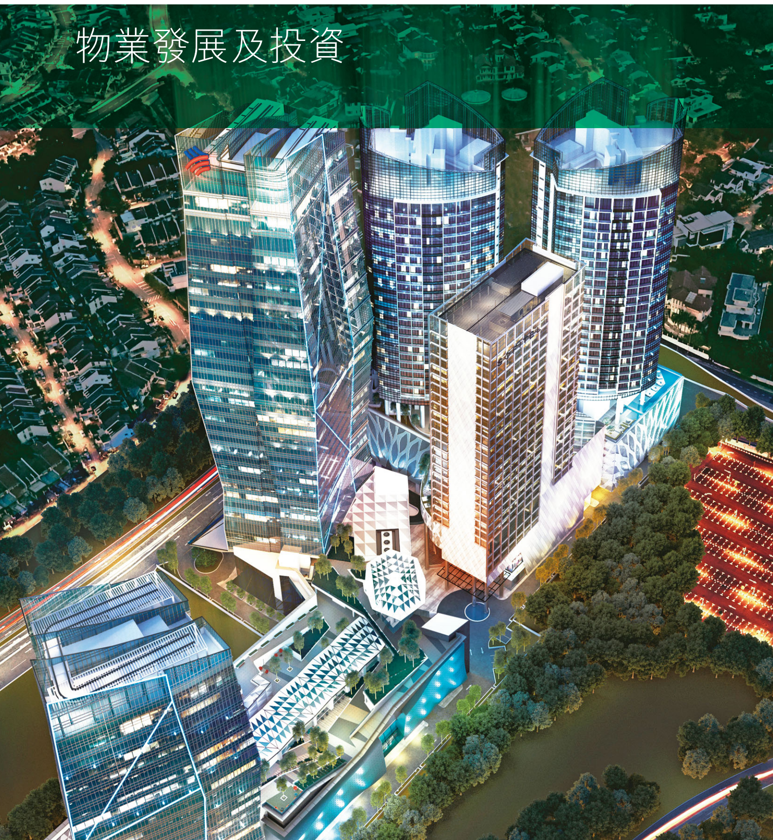
高空鳥瞰白沙羅城，馬來西亞(構思圖)