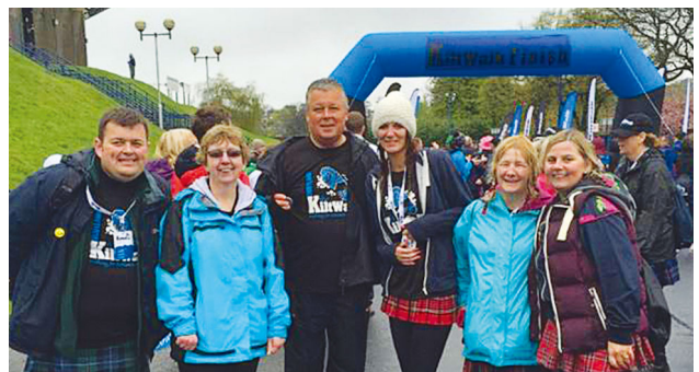
Rank員工參加Carers Trust蘇格蘭裙慈善步行

GL的附屬公司GLH Hotels Limited已成立慈善基金「Lite@Nite」，鼓勵英國的全體員工參與關注弱勢兒童的福利，並提高對兒童問題的關注。過去兩年，Lite@Nite透過團隊活動，包括10公里贊助步行、1,400公里全國酒店接力賽(當中包括10公里跑步)及多項酒店籌款活動，為認可的兒童慈善機構籌得250,000英鎊。Lite@Nite亦贊助兒童樂趣三項鐵人賽。