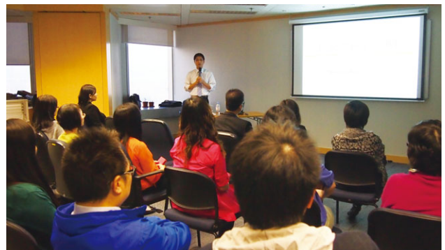
國浩員工參與由外部顧問主講的工作坊

本集團的政策，在於鼓勵員工參加合適的課程，提升其能力以改善工作表現和發展事業。有見及此，本集團為員工舉辦工作坊、研討會和培訓課程，涵蓋各個方面，藉以提高其技能和知識水平，並發揮其最大潛能。本集團亦鼓勵員工報讀公司之外研修課程，通過獲取更高的專業資格或者參加與工作有關的課程，充實自己。