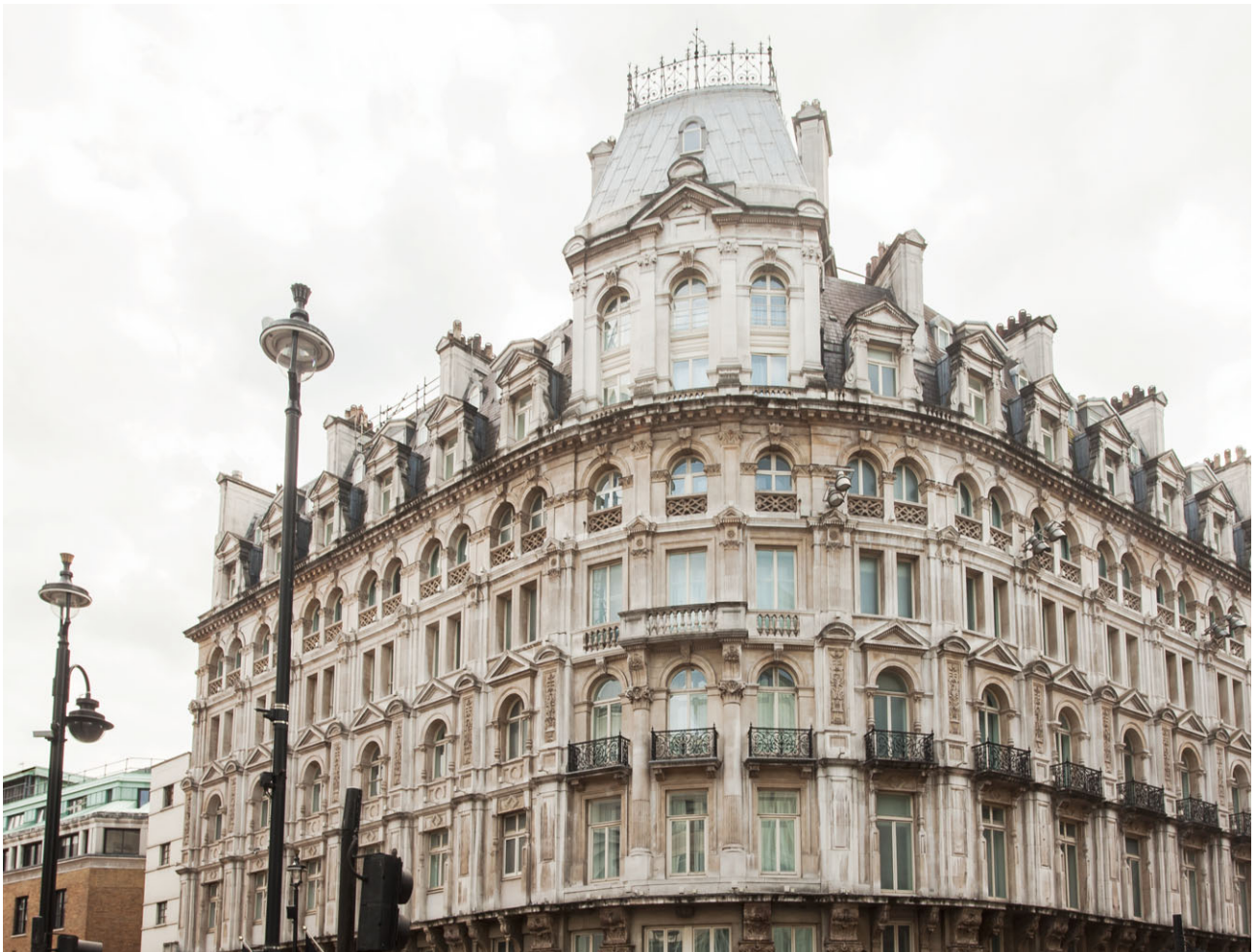
倫敦Every Hotel Piccadilly

於全球石油市場方面，預期油價來年不會顯著復甦，對GL石油及燃氣特許權收益繼續造成不利影響。