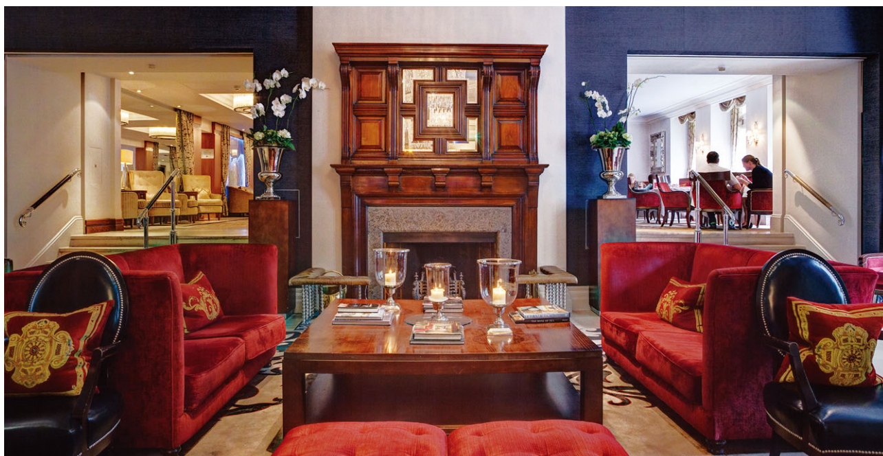
倫敦The Royal Horseguards Hotel大堂