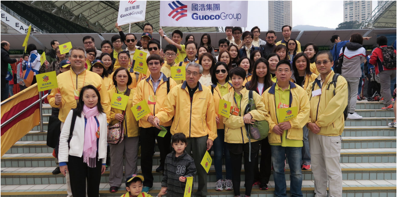
國浩員工參加香港公益金二零一六年百萬行