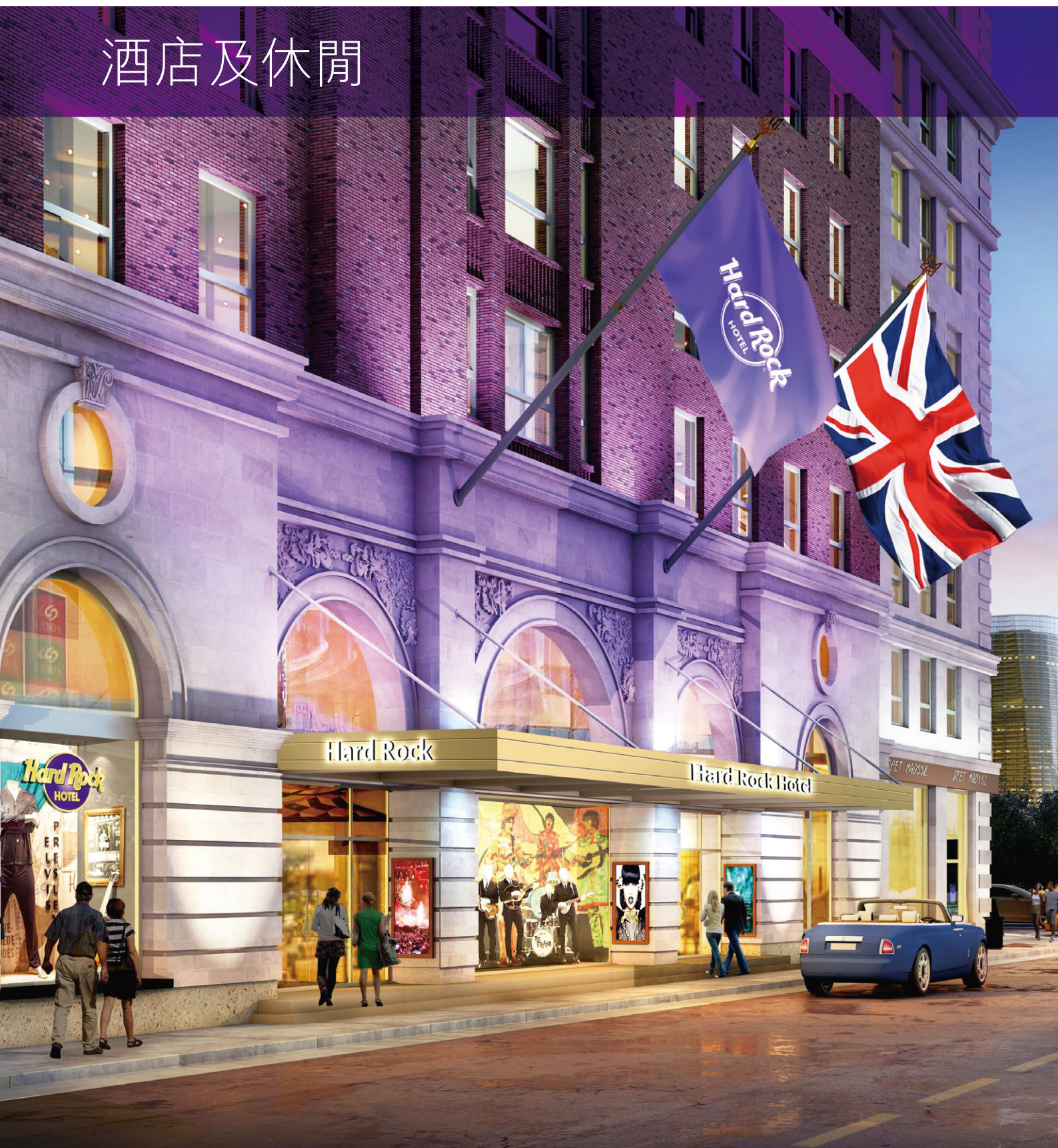
倫敦Hard Rock Hotel – 將由Cumberland Hotel改建而成(構思圖)