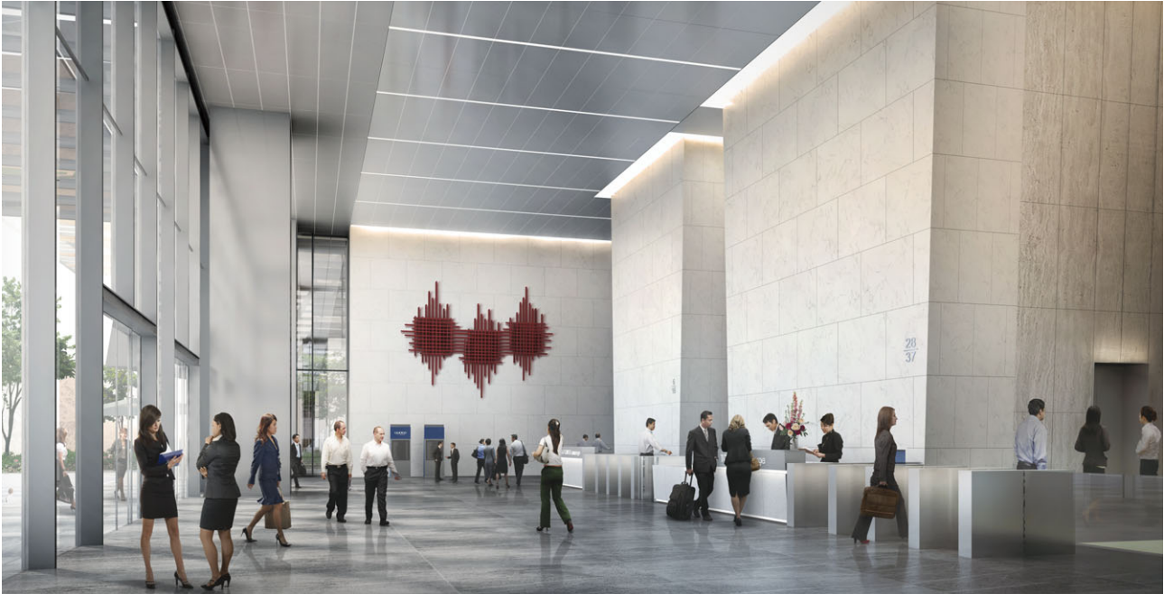
新加坡Tanjong Pagar Centre之Guoco Tower辦公大堂(構思圖)