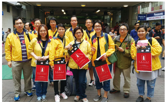
國浩員工參加香港公益金賣旗日