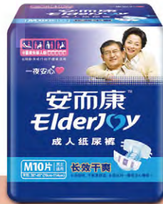
「安而康」成人紙尿褲