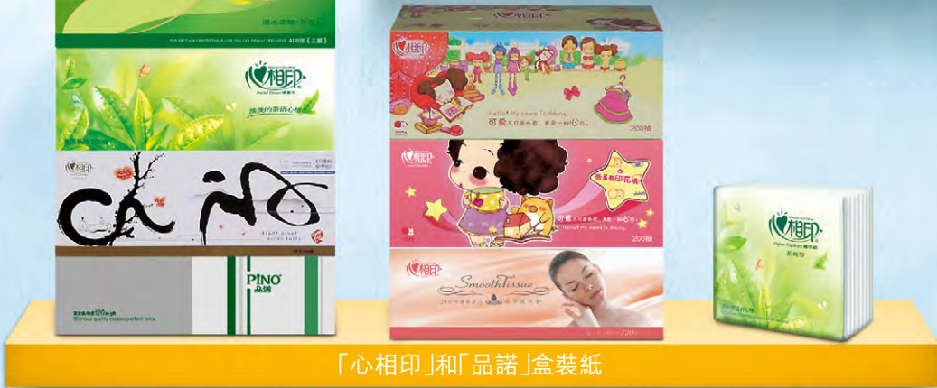
「心相印」和「品諾」盒裝紙