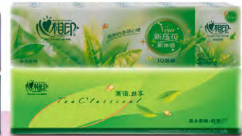
「心相印」與「品諾」手帕紙