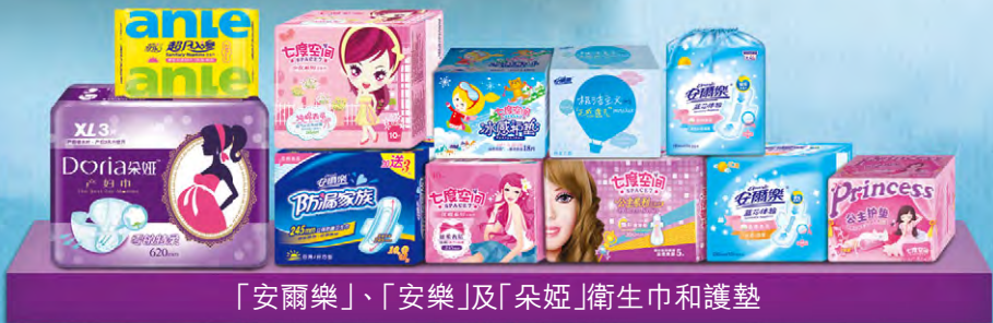
「安爾樂」、「安樂」及「朵婭」衛生巾和護墊