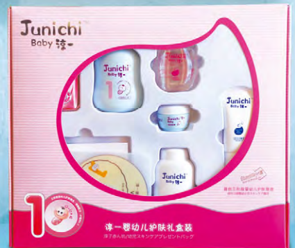
「淳一」嬰兒護膚產品和「美媛春」潔膚護膚產品