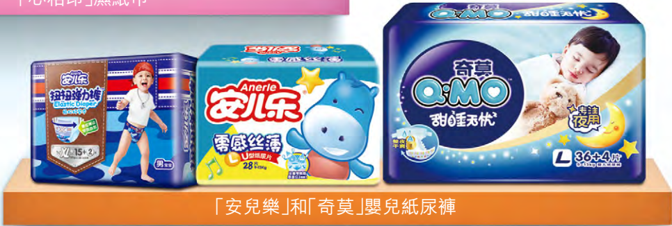
「安兒樂」和「奇莫」嬰兒紙尿褲