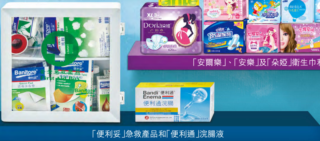
「便利妥」急救產品和「便利通」浣腸液