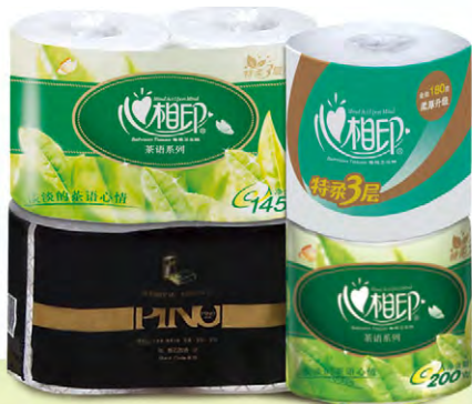
「心相印」與「品諾」衛生紙