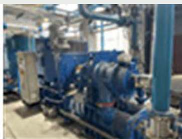
空壓機餘熱回收機組

報告期內，內江廠區針對空壓機採取了設備改善和能源回收的措施，以減少能源的消耗。其中，以710千瓦離心式空壓機取代12台75千瓦老式空壓機，節省用電量，預估全年節省131萬度電。另外，內江廠區利用空壓機散發的熱量對生活區所需的熱水進行加熱，預估全年節省47.52萬立方米的天然氣。