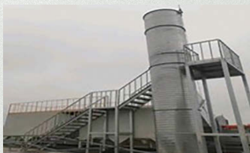
注塑廢氣處理系統