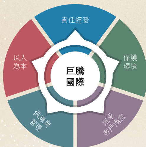
巨騰國際使命願景

巨騰國際始終以質量優先、科學管理及可持續發展為根本。過去的23年，各國政府和市場對電子行業產業鏈的要求愈發嚴格，我們依靠自身先進的技術、負責任的態度、專業的服務以及優良的產品品質贏得了全球客戶的認可。我們深知，好的企業不只表現在其產品本身，同時還體現在企業的管理水平和可持續發展能力上。我們本著為社會負責、推動上游企業共同進步、維護廣大投資者利益的目標，通過以下五個方面的深耕，致力於電子行業的可持續發展。