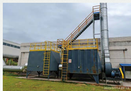
兩級活性炭吸附處理設備