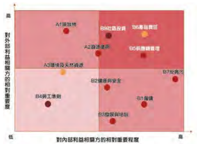
主要利益相關方對環境、社會及管治指引各層面關注度分析矩陣圖

本集團亦針對香港聯交所《環境、社會及管治報告指引》中列出的11個層面，邀請內外部利益相關方對各層面關鍵議題重要性進行了評估，識別出利益相關方主要關注的層面，包括社區投資、產品責任和供應鏈管理等。