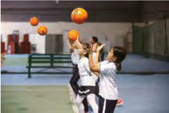
來訪學生進行運動體驗

本集團始終重視與各類中小學和高校之間的交流，我們歡迎對李寧品牌及李寧園區感興趣的學生以團隊形式參觀本集團辦公園區。2018年，本集團北京總部辦公園區共接待了來自北京小學、北大附小、朝陽區將台路小學、白家莊小學、十八里店中學等11所學校的4,431名學生。本集團安排了志願者帶領來訪學生參觀了園區的主要場所，學生們還在園區教練的指導下，實地體驗了李寧中心的各類運動設施。我們也期待通過持續開展中小學生參觀活動，讓更多的青少年更好地瞭解本集團、瞭解體育產業、愛上體育運動。