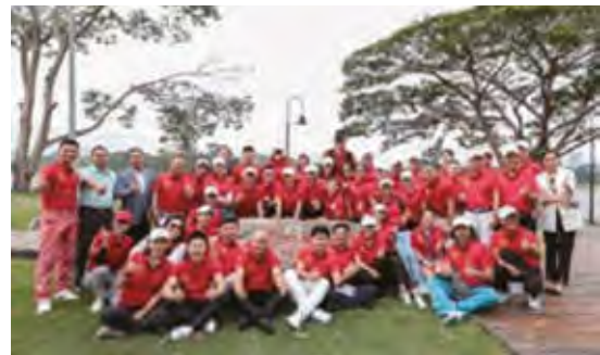
各界愛心人士合影

2018年11月，「2018中國運動員教育基金世界冠軍高爾夫慈善賽」於深圳正中高爾夫球會揮杆開賽，基金發起人之一、執行主席李寧先生親臨現場為公益助力。活動現場，許多愛心人士也慷慨解囊，為公益獻上了自己的一份力量。在李寧先生與各界愛心人士的全力支持下，當天晚宴以拍賣形式為公益助力，所募所有善款將用於支持中國貧困及偏遠地區的教育發展。