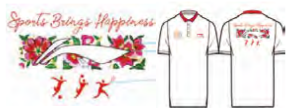
義賣產品設計圖稿

2018年5月，由中國運動員教育基金會發起人之一、執行主席李寧先生與世界冠軍們共同發起並捐資成立的中國運動員教育基金會携手本集團，以義賣的形式凝聚大家的愛心與力量，所得款項全部用於中國運動員教育基金會包括「風雨操場」及「不一樣的體育拓展」在內的體育公益活動。本集團與中國運動員教育基金會一直致力於中國貧困及偏遠地區的教育發展與體育設備的援建，至今已建設44所「中國運動員希望小學」和37所「風雨操場」以及配套的希望工程圖書室與體育教師培新項目，讓偏遠地區的孩子們體會體育的魅力，養成強健的體魄和健全的人格。