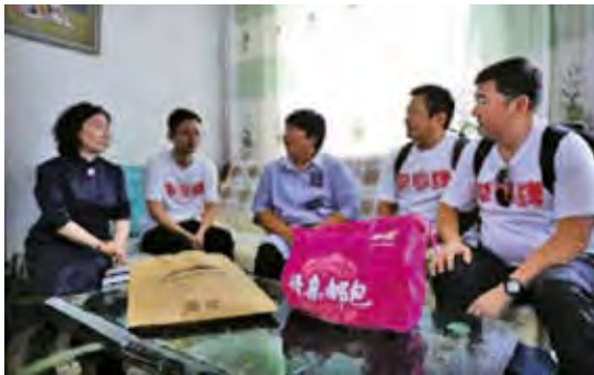
到貧困母親家中探訪慰問

2018年7月，「2018李寧公司關愛貧困婦女兒童公益捐贈內蒙古探訪活動之母親郵包」捐贈落地儀式在呼倫貝爾市新區舉行。本集團通過中國婦女發展基金會向內蒙古自治區婦聯捐贈了物資，來自海拉爾區、鄂溫克族自治旗和陳巴爾虎旗的60名母親和30名青少年兒童在儀式現場接受了捐贈。捐贈儀式結束後，中國婦女發展基金會和本集團探訪小組深入到鄂溫克族自治旗巴彥塔拉鄉4戶貧困母親家中探訪慰問。「母親郵包」項目開展六年以來，本集團已向該項目捐贈款物總計達5,650萬元人民幣。