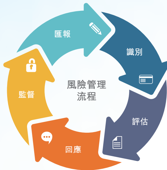
圖一、風險管理流程