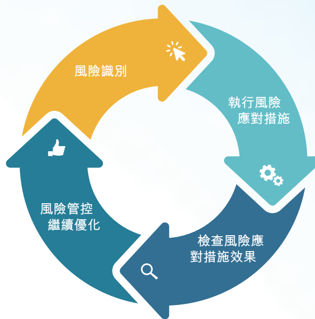
圖二、風險評估管控模式

本年度，集團管理層通過對上年度風險評估中識別的管控提升點的落地情況進行跟進，形成持續的「風險識別－風險管控落地－檢查跟蹤－持續優化」的循環管控模式，確保重大風險管理薄弱點得到有效改善，以持續提升集團的風險防範與應對能力(詳見圖二：風險評估管控模式)。