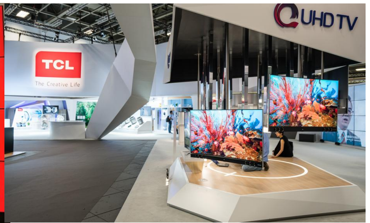
TCL 榮獲「IFA 產品技術創新大獎」量子點技術金獎