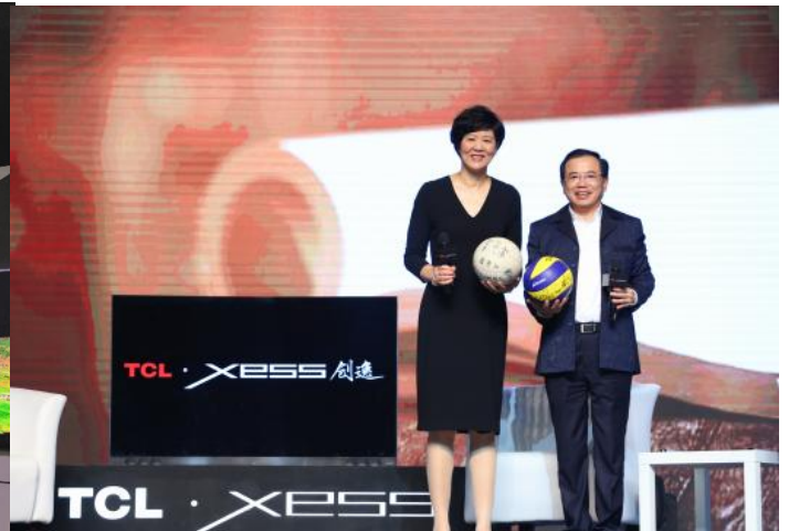
中國女排主教練郎平成 XESS 創逸高端電視產品形象代言人