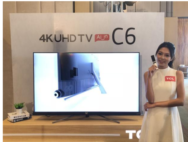
TCL 4K UHD TV