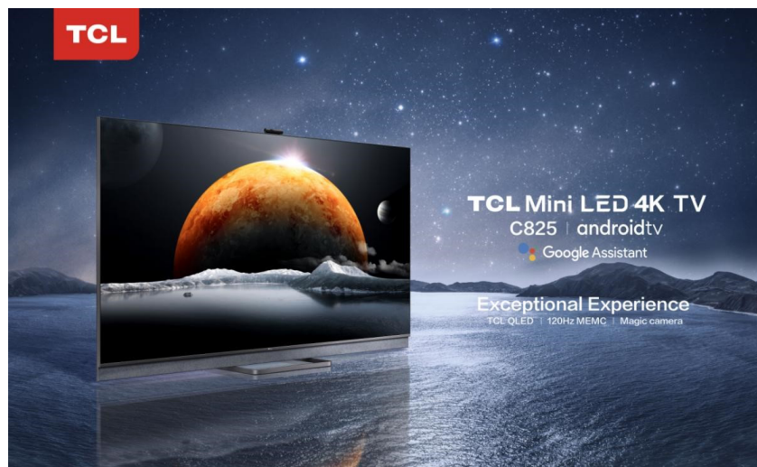
4K Mini-LED TV C825 以更高的色域和更精准的光線控制，實現極致的畫質效果

作為全球電視機行業的領先企業，TCL 電子銳意進取，不斷推陳出新，讓全球客戶從創新的電視機產品中獲得無與倫比的使用者體驗。在 2021 CES 上，TCL 電子推出了多款電視新品，包括 4K Mini-LED TV C825、TCL 4K QLED TV C725 和 TCL 4K HDR TV P725，將下一代顯示技術帶入現實。作為 TCL Mini-LED 顯示技術的重要系列產品之一，TCL C825 採用多分區背光控制技術，實現對亮度的細膩調節。該款電視採用量子點顯示技術，以更高的色域和更精准的光線控制，實現極致的畫質效果。同時，TCL C825 搭載杜比視界，並支持杜比全景聲，讓用戶安享家中就能體驗影院級震撼視聽體驗。TCL C825 支援 120Hz MEMC 技術，同時內置電競神裝功能，為遊戲玩家帶來非凡流暢體驗。另一方面，C825 極致的視聽效果，獲得 Imax Enhanced 認證，讓用戶在家也能享受無與倫比的娛樂體驗。