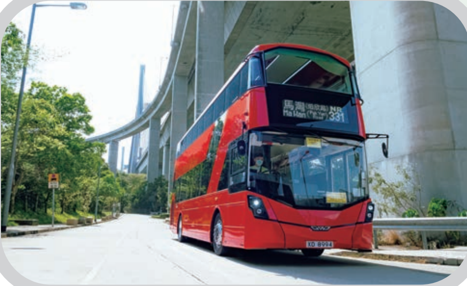
▲ 陽光巴士車隊配備雙層巴士，以滿足顧客的出行需要