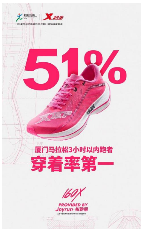
特步 160X 2.0

隨著中國公眾健康意識提高，加上國潮的大趨勢下，越來越多跑者傾向選擇國內品牌跑鞋參與賽事。根據悅跑圈的數據顯示，在 2021 年廈門馬拉松三小時內完成賽事的參賽者中，穿著特步「160X」系列跑鞋的人數佔比達 51%（2019 年：4.2%），遠拋離其他國內外品牌，可見特步的跑者穿著率在兩年內實現了跳躍式增長。另外，在徐州馬拉松這場的賽事上，跑進前九位的運動員中，七名跑者都選擇了特步的代表跑鞋 – 「160X PRO」參賽，當中包括了賽事上得到冠、亞和季軍的彭建華、楊紹輝和董國建，全也穿著「160X PRO」在此次比賽中成功取得東京奧運會馬拉松項目的參賽資格。值得一提的是，自 2019 年 12 月「160X」上市以來，集團於 2020 年見證了八位特步贊助的運動員穿著 160X 在 26 項馬拉松和各項跑步賽事中獲得冠軍。加上在徐州馬拉松獲得的傑出成績，充分印證了集團的尖端技術和助力專業運動員實現突破以往速度水平所付出的不懈努力。