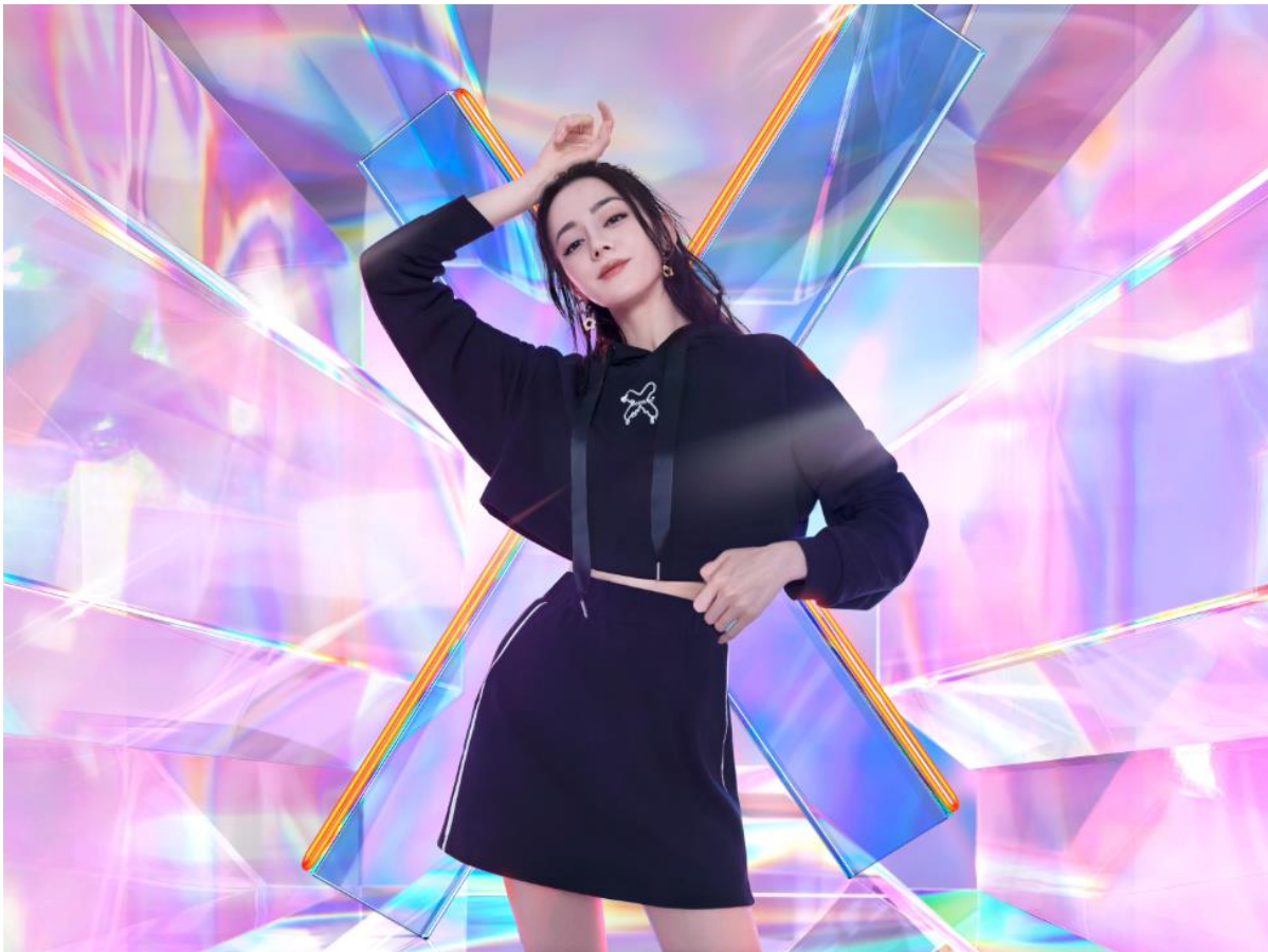
特步簽約迪麗熱巴並推出全新女性品類「半糖系列」

迪麗熱巴作為最炙手可熱的新生代青年演員之一，迪麗熱巴屬於低調踏實且正能量的優質偶像，完美契合特步提出的Z世代年輕一代所擁有的樂於創造與專注堅韌的品質，對年輕粉絲有著正向的引導作用；在時尚領域迪麗熱巴也一直保持著良好的口碑，具有駕馭各類風格的時尚表現力。所以無論從青年一代精神層面的共鳴，到多變時尚的形象資產，再到優秀的行業口碑與商業價值都讓迪麗熱巴成為了特步品牌代言人的合適之選。