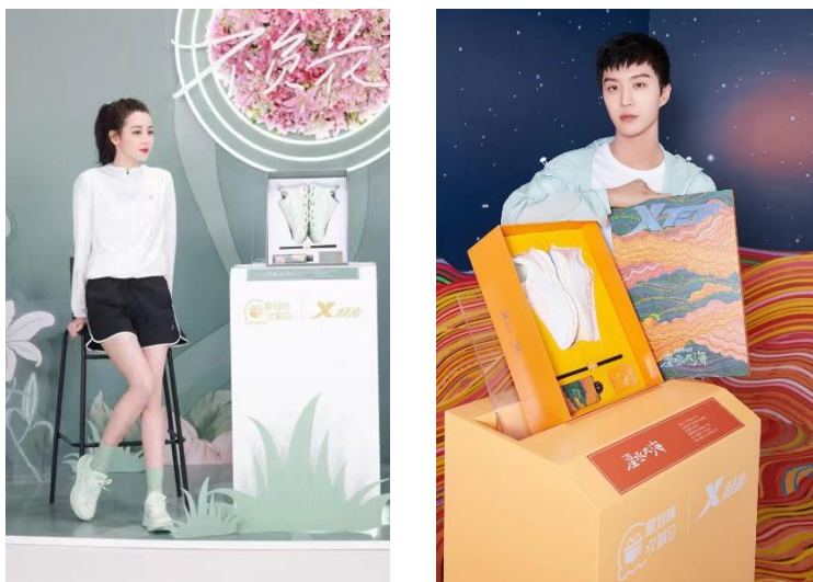
特步品牌代言人迪麗熱巴及范丞丞發佈新品「減震旋 9.0」及其明星同款禮盒

特步推出數字藏品「160X-Metaverse」成為國內首個開啟跑步元宇宙的運動品牌 160X 系列跑鞋「160X 3.0」於第七屆特步 321 跑步節暨新品雲發佈會矚目亮相 2022 年 3 月 22 日