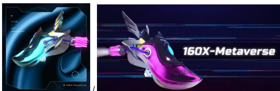
特步跑步元宇宙數字藏品「160X-Metaverse」上線開售短短70分鐘旋即售罄

特步集團第一次進入虛擬領域，在線上發佈會上發佈首款數字藏品「160X-Metaverse」，成為國內第一家開啟跑步元宇宙的運動用品品牌。「160X-Metaverse」售價為人民幣1,603元，限量321份，上線短短70分鐘旋即售罄，掀起一陣搶購熱潮。此倍受矚目的大眾運動品牌與區塊鏈技術之合作，一起構建跑步元宇宙，開創「體育+數字經濟」新模式。