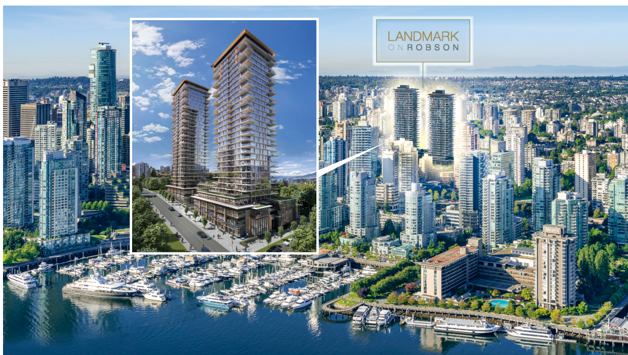
加拿大溫哥華 Landmark on Robson