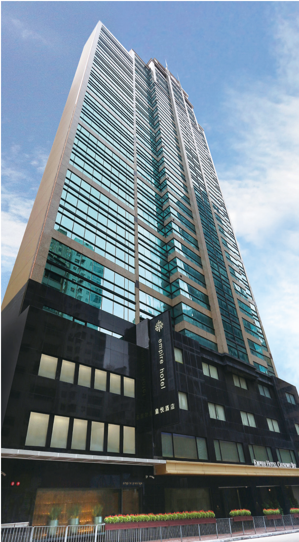
銅鑼灣 - 皇悅酒店及皇悅卓越酒店

房地產業務的公司發行)，約3%為上市銀行股票，及1%為非上市基金證券。該等投資組合59%以美元，38%以人民幣及3%以港元計值。