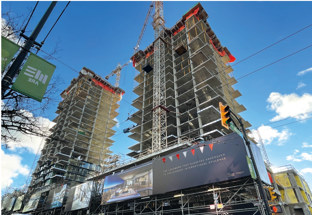
位於加拿大溫哥華的「Landmark on Robson」發展項目